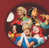
ATRIZES DA CIA DESCARGA