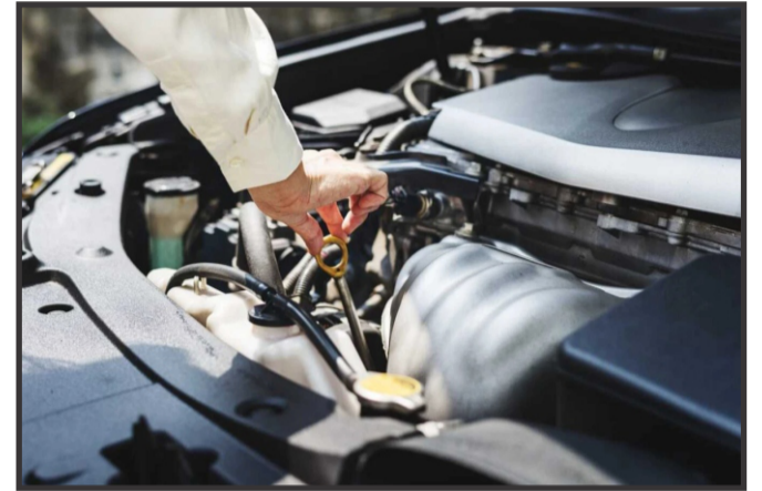
Com informações - www.otempo.com.br/autotempo

Seguir o manual do proprietário e escolher o óleo certo pode ser a diferença entre manutenção preventiva e um reparo de emergência oneroso.