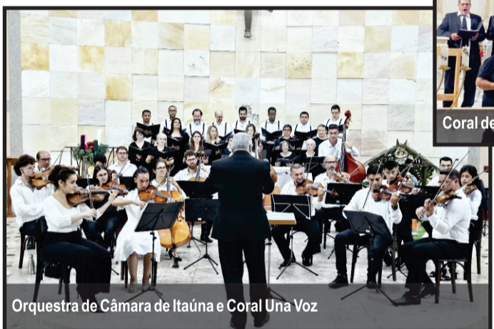
Orquestra de Câmara de Itaúna e Coral Una Voz

cionaram momento de enlevo em uma atmosfera envolvente e reconfortante. Itaúna celeiro de grandes artistas que sempre nos trazem o encantamento.