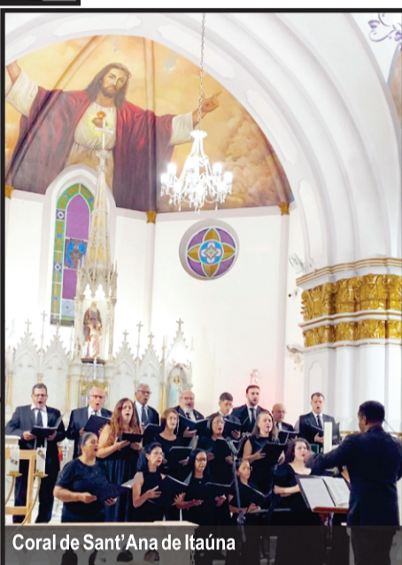
Coral de Sant'Ana de Itaúna