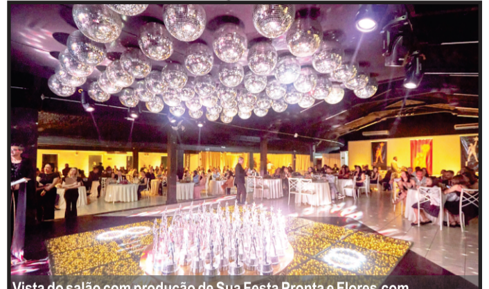
Vista do salão com produção de Sua Festa Pronta e Flores.com