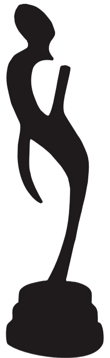
Troféu Feminino Plural