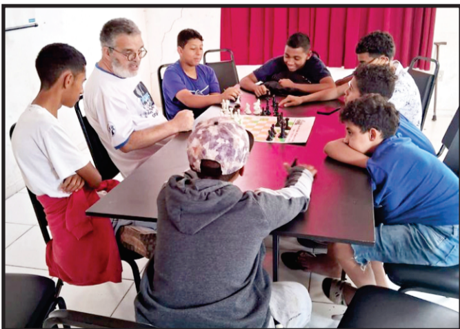
Registro do Projeto Xadrez Ilumina na Escola Estadual do Bairro São Geraldo, estudo temático da abertura espanhola ou Ruy Lopes

ASSINE O NOSSO jornal ENTRE EM CONTATO PELO WHATSAPP 37 99118.3000