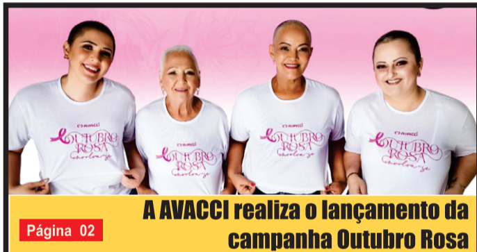
A AVACCI realiza o lançamento da campanha Outubro Rosa Página 02