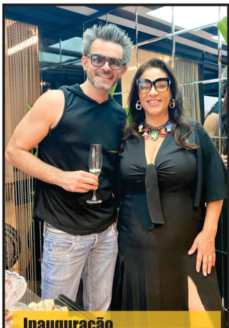
Inauguração Yes Trend Brazil Página 02