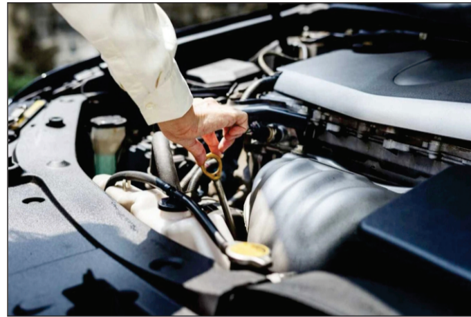
Com informações www.otempo.com.br/autotempo

para garantir o bom funcionamento do motor e evitar problemas futuros. Além de verificar o nível de óleo, é importante trocar o óleo e o filtro de óleo regularmente, conforme as recomendações do fabricante.