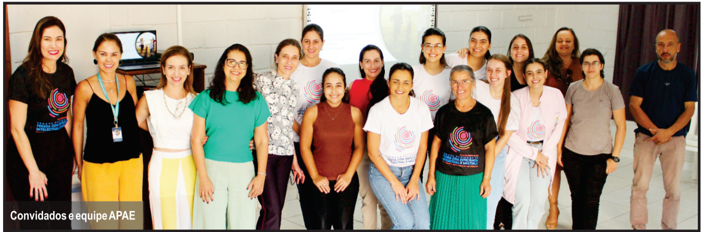
Convidados e equipe APAE

também estiveram presentes para apresentar o Programa Nota Fiscal Mineira, um novo programa do Governo Estadual que incentiva o cidadão a solicitar em suas compras o cupom fiscal, informando o CPF e assim estará concorrendo a prêmios de R$100 a R$1.000.0000 e ainda podem indicar 3 instituições para receberem prêmios também. Bastando para isso baixar o aplicativo e fazer o cadastro uma única vez. Com essa prática o governo pretende aumentar a arrecadação de impostos para serem aplicados em políticas públicas. Esse ano a APAE Brasil completa 70 anos e a de Itaúna 54 anos, e a luta hoje é por equidade, a igualdade trata a todos da mesma forma, sem distinção, a equidade parte do princípio de que as pessoas tem diferentes necessidades e que nem sempre largam do mesmo ponto de partida. Acompanhe a programação completa no instagram da APAE de Itaúna.