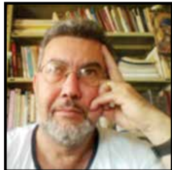
Prof. Fonte Boa Academia Itauense de Letras Cadeira 02 - Patrono: Manoel de Barros

Veja, apresentei aqui três aspectos do moderno na poesia moderna, e tem outros inúmeros. Mas, o que é importante ressaltar é que o movimento modernista vai transformar como lidamos com a poesia, com a sua forma de expressão, com os seus temas, com a sua estrutura. E como toda escola, tem pessoas que gostam e tem pessoas que não gostam. Eu... bom eu... deixa para lá. Isso não importa muito. Para mim a poesia não é só um jeito de ver o mundo, mas um jeito de estar nele.