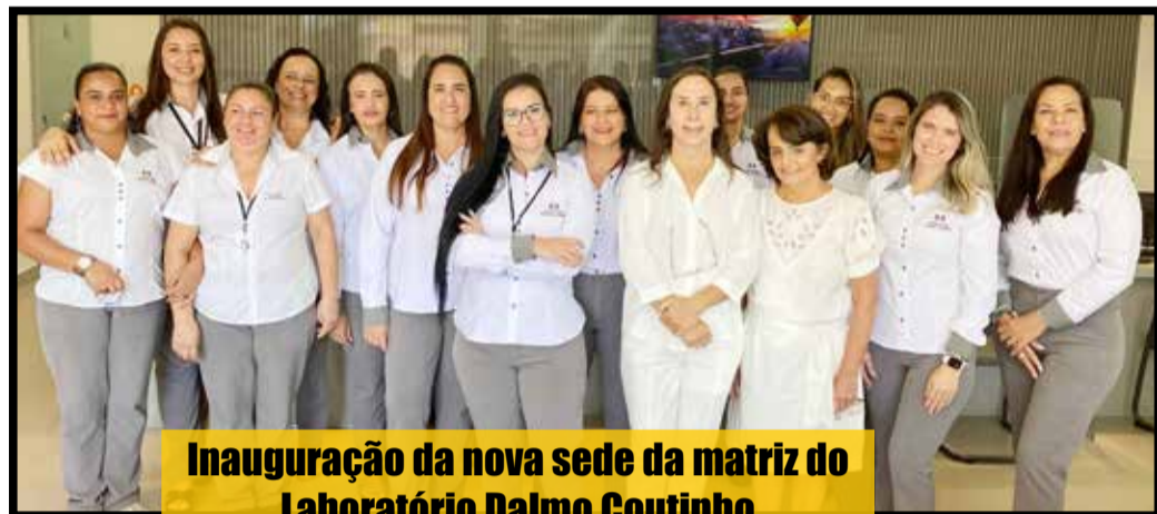
Inauguração da nova sede da matriz do Laboratório Dalmo Coutinho em Itaúna Pág. 06