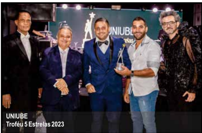
UNIUBE Troféu 5 Estrelas 2023