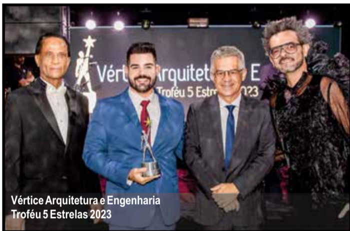
Vértice Arquitetura e Engenharia Troféu 5 Estrelas 2023