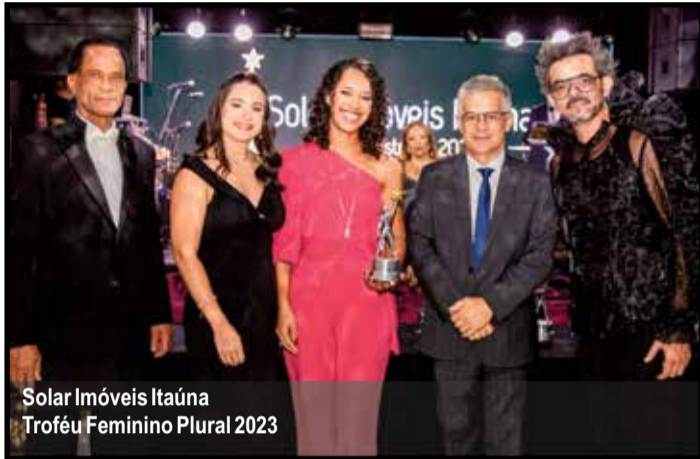
Solar Imóveis Itaúna Troféu Feminino Plural 2023

palco Breno Costa in Jazz que deixou a pista super concorrida. Cada detalhe da noite foi cuidadosamente registrado pelas lentes do renomado Stúdio Mariana Rezende.