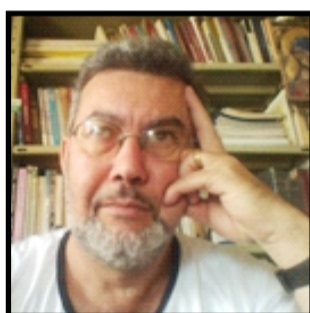
Prof. Fonte Boa Academia Itaunense de Letras Cadeira 02 - Patrono: Manoel de Barros

Mas este será o assunto do próximo texto. Por enquanto fica a conclusão de que em poema, tamanho não é documento... não mesmo.