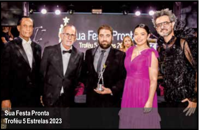
Sua Festa Pronta Troféu 5 Estrelas 2023