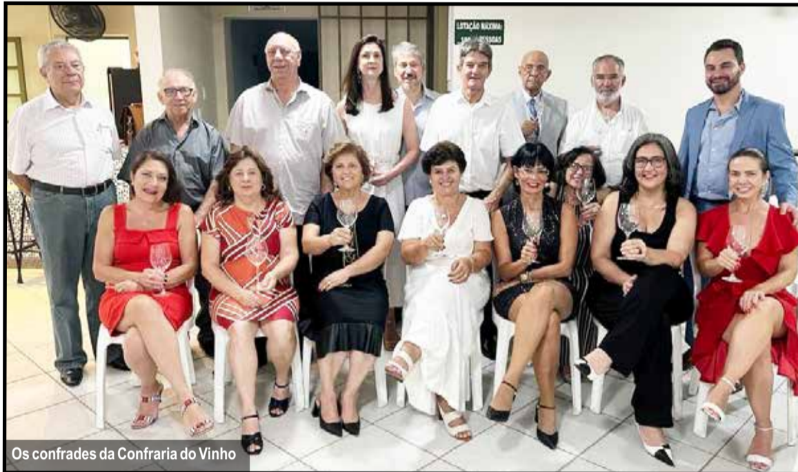
Os confrades da Confraria do Vinho