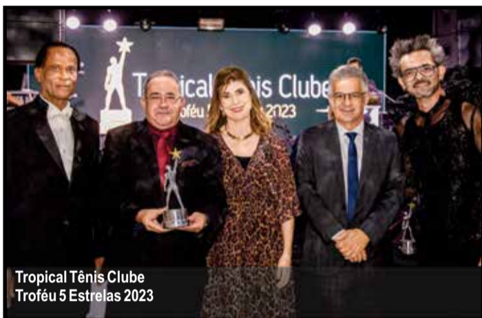
Tropical Tênis Clube Troféu 5 Estrelas 2023