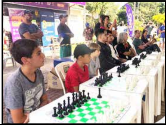
2023 foi também marcado pela realização de uma simultânea na Praça da Matriz com a parceria com a Secretaria de Esportes e da OAB