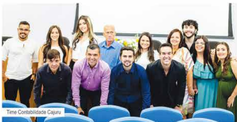
Time Contabilidade Cajuru