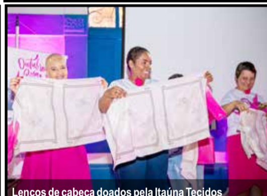
Lenços de cabeça doados pela Itaúna Tecidos