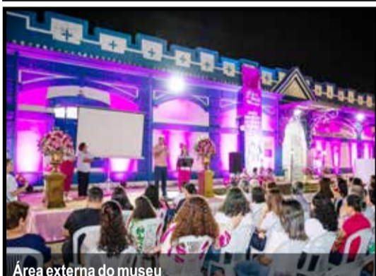
Área externa do museu