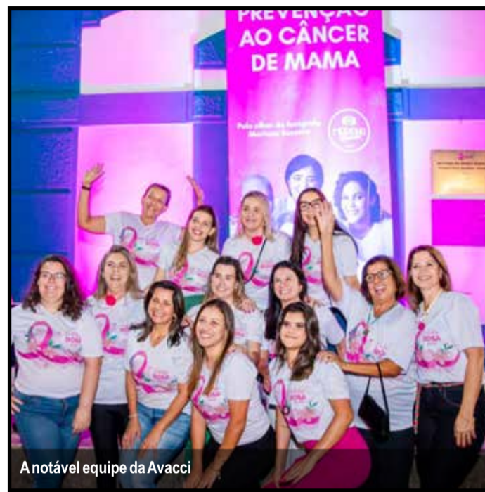
A notável equipe da Avacci