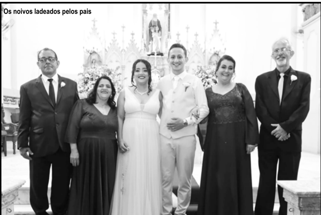
Os noivos ladeados pelos pais