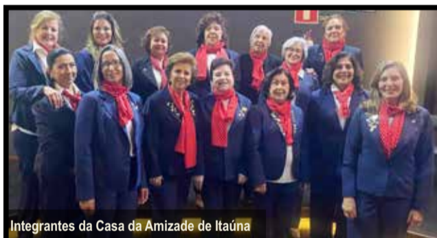
Integrantes da Casa da Amizade de Itaúna