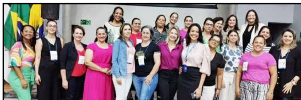
Projeto SEBRAE Delas em parceria com Sicoob Crediluz e Prefeitura de Luz, por meio da Sala Mineira do Empreendedor