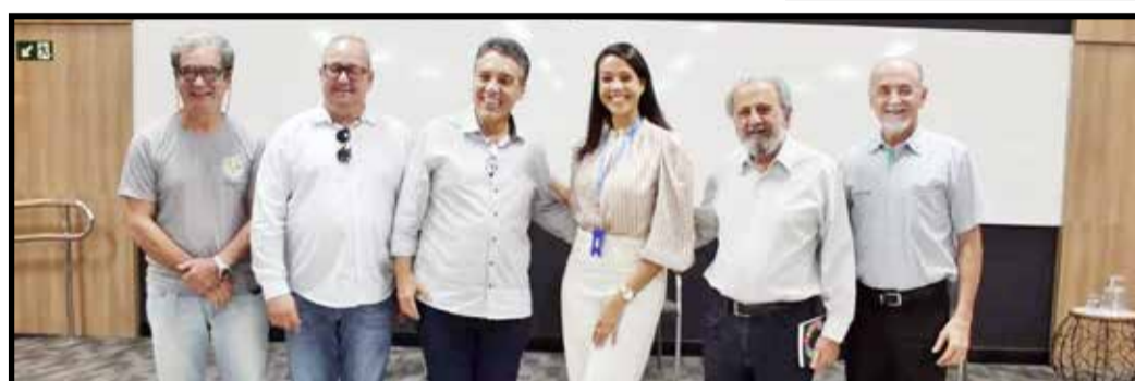
Poliana com o prefeito de Bom Despacho, Dr Bertolino e o ex Ministro da Fazenda, Paulo Haddad em reunião sobre cenário econômico na CDL Acibom (Bom Despacho)