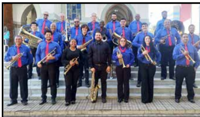
Banda Sagrado Coração de Jesus